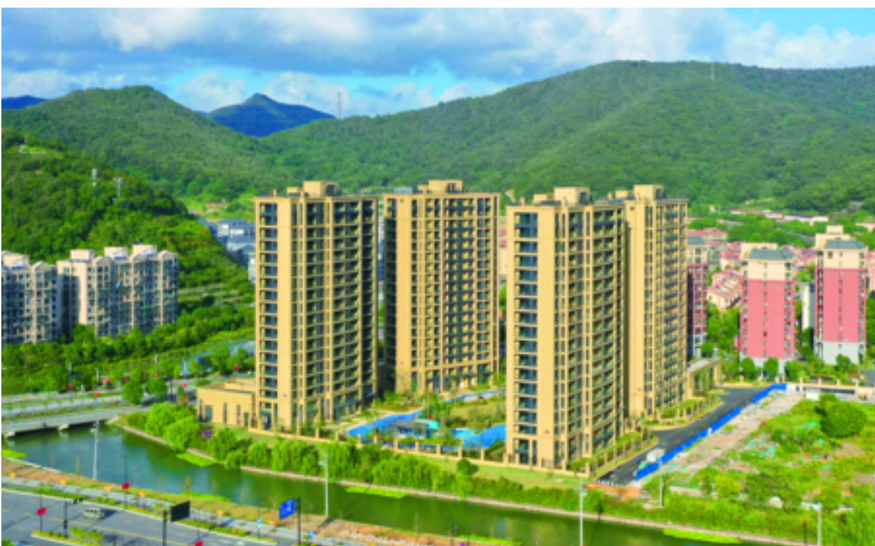
安置房精品工程拔地而起