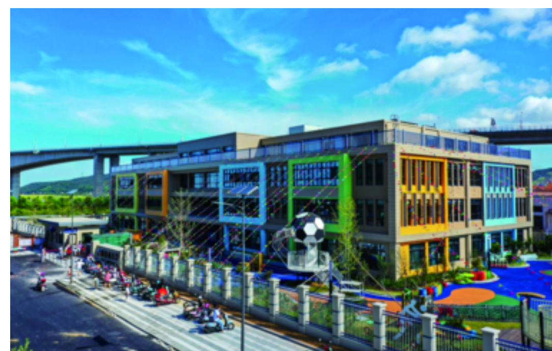
切实加大教育供给能力