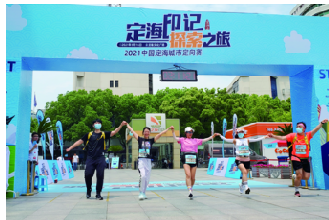
着力培育精品赛事