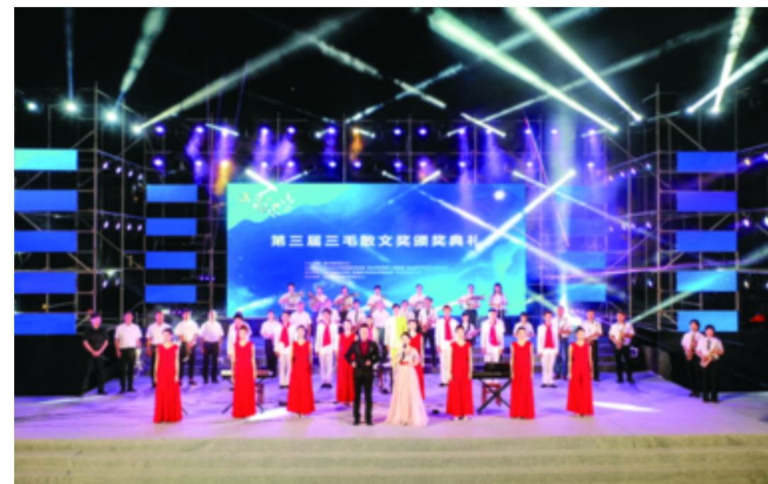
打造文化品牌厚植人文底蕴

乘势而上,接续奋斗。站在“两个一百年”的历史交汇点上,定海将凝心聚力,担当作为,坚定不移当好“重要窗口”海岛风景线排头兵,奋力争创高质量发展建设共同富裕示范区港城标杆。