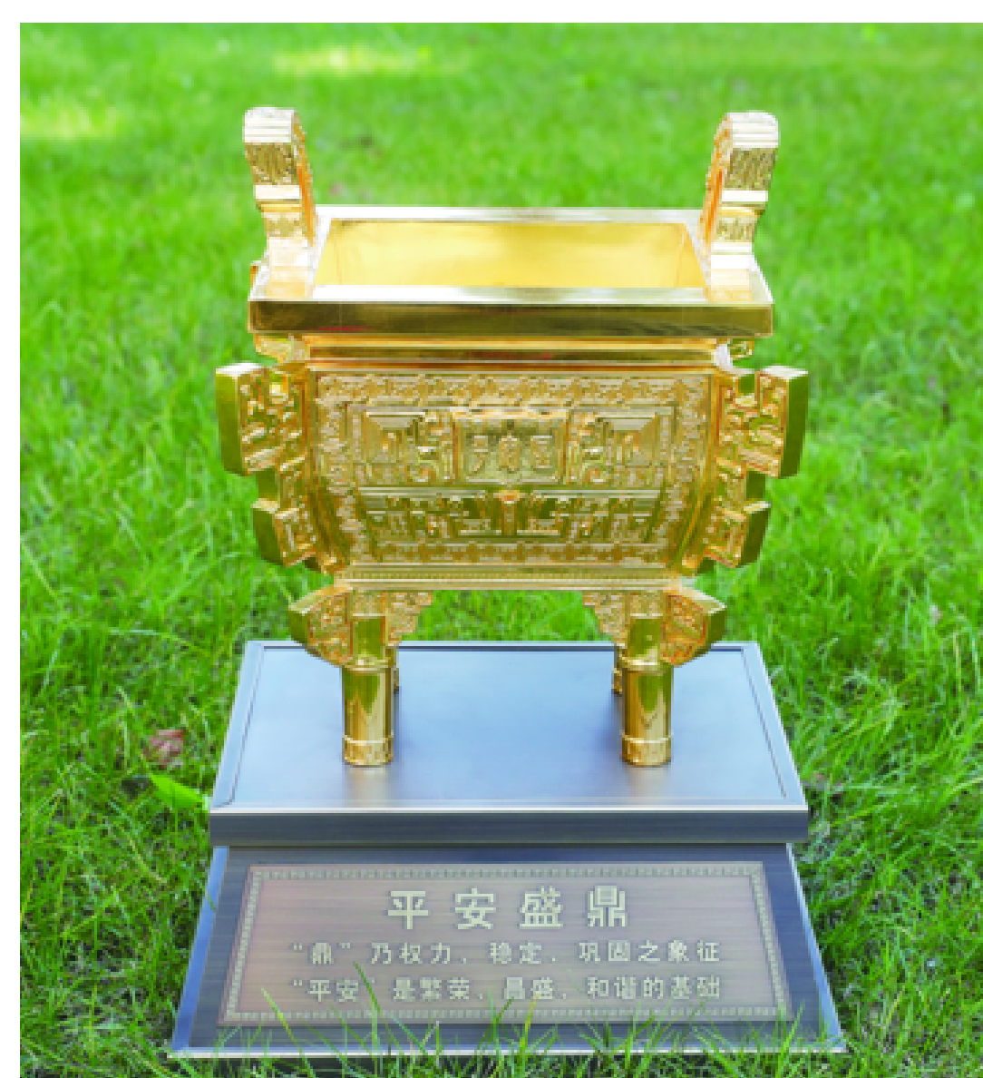
成功夺取全省首批“一星平安金鼎”