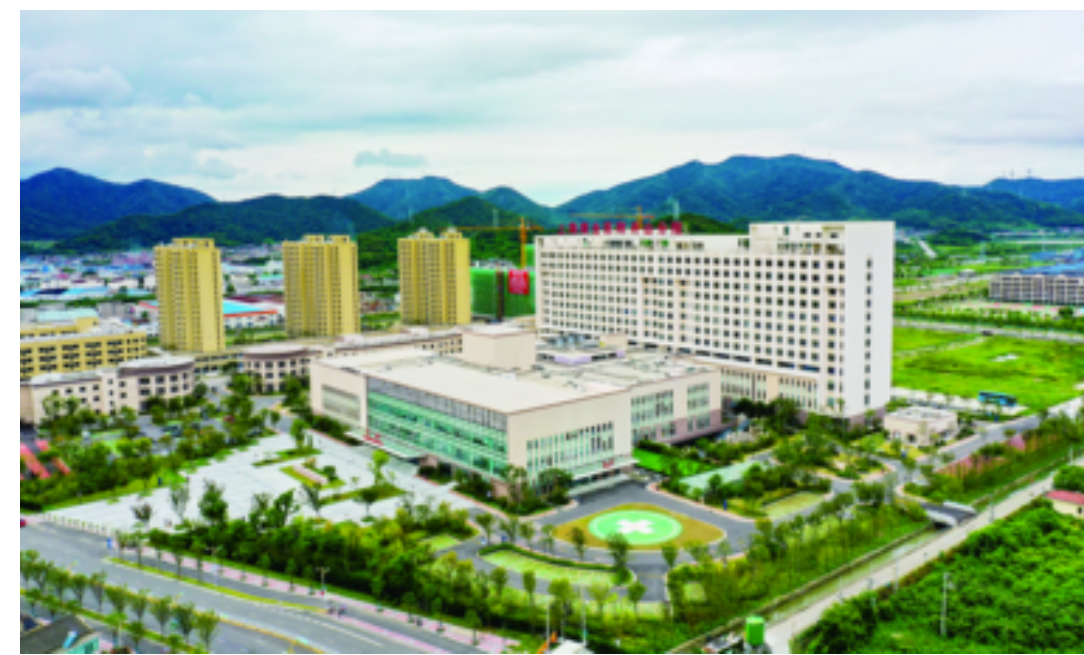
推动优质医疗资源紧密合作