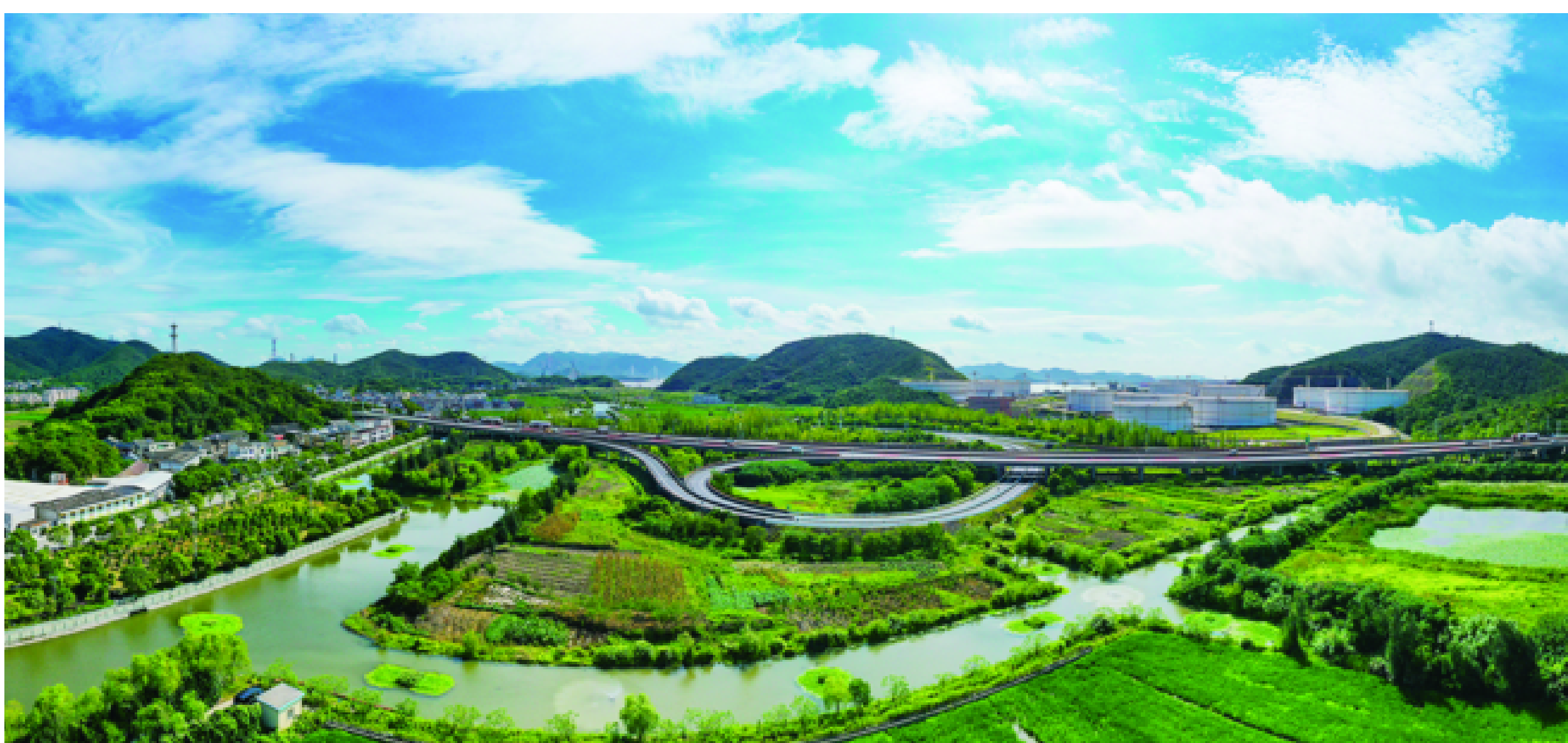
美丽乡村画卷徐徐展开