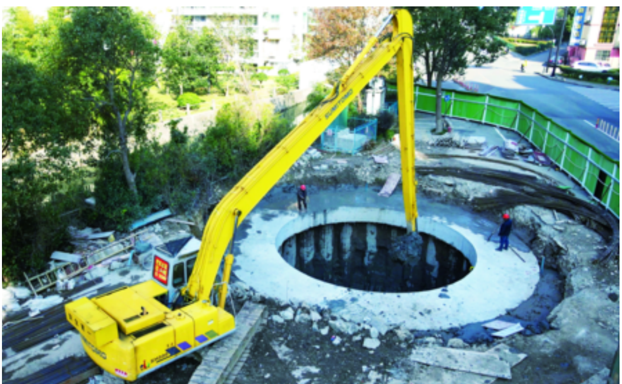
立体式构造建立新的排涝体系