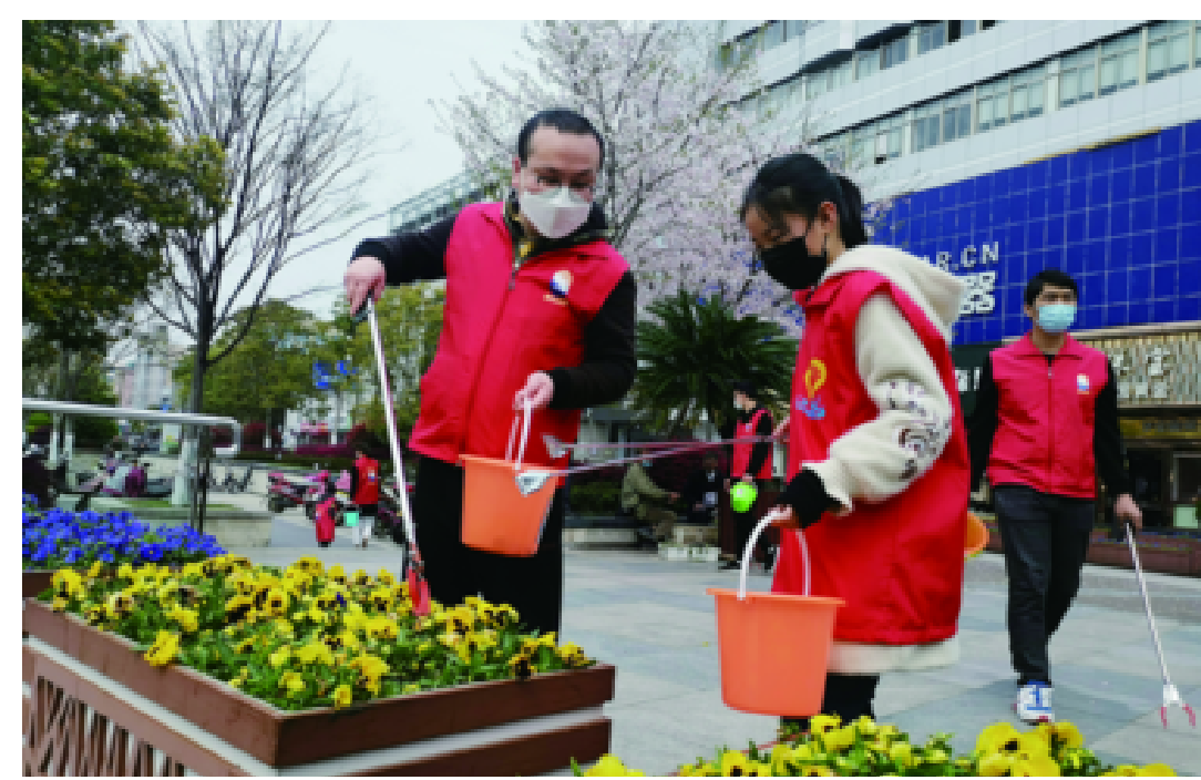
处处可见文明风尚